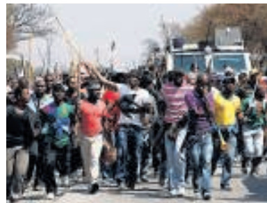
Acties bij een platiummijn.

AMSTERDAM – Geen nieuw vliegveld bij Londen, maar verdere uitbreiding van Heathrow. Een commissie heeft de Britse regering geadviseerd een derde en eventueel vierde landingsbaan bij de grootste luchthaven van Europa aan te leggen. Een plan voor een vliegveld in de monding van de Theems is te duur.